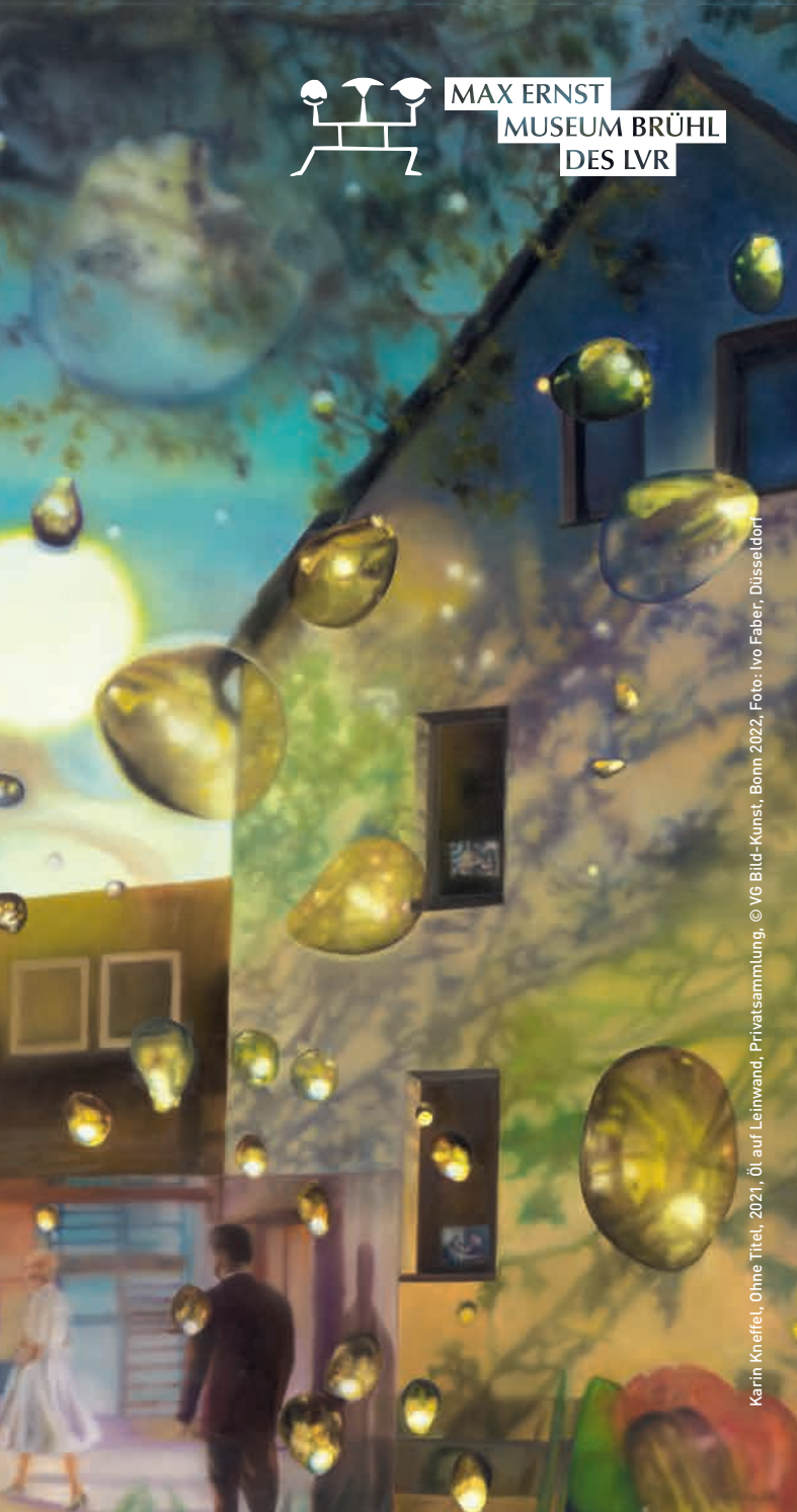
Karin Kneffel, Ohne Titel, 2021, Öl auf Leinwand, Privatsammlung, © VG Bild-Kunst, Bonn 2022, Foto: Ivo Faber, Düsseldorf