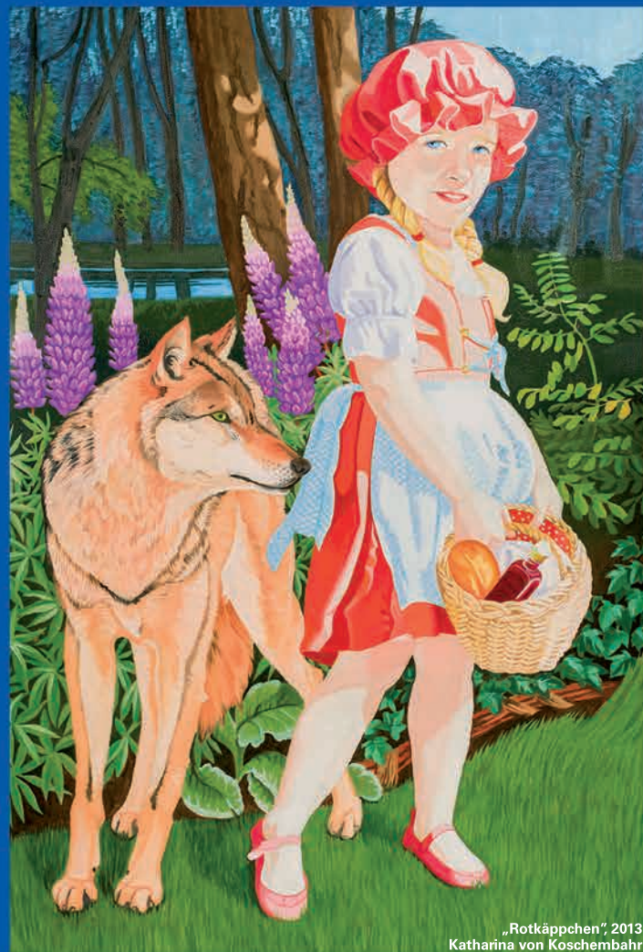
„Rotkäppchen“, 2013 Katharina von Koschembahr